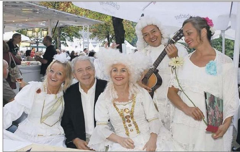
Der gelungene Musikmix sorgt für beste Stimmung beim Kurpark-Meeting. Dort werden auch optische Kontraste geboten – zum Beispiel durch die „Artistokraten“.